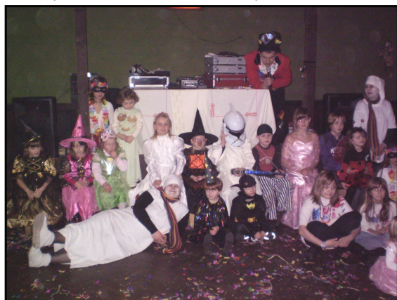
Dětský maškarní karneval

V uplynulých měsících se konaly tyto kulturní a společenské akce.V měsíci únoru pořádali hasiči bál a Potrefené Julie maškarní karneval pro děti.V březnu pořádala TJ svou již tradiční fotbalovou tancovačku a Potrefené Julie Josefskou zábavu.Na všech těchto akcí nechyběla dobrá nálada , obzvlášť na té pepické ,která byla tak trochu ve stylu třicátých let .Díky Všem ,kteří se podílejí na pořádání takovýchto akcí a zároveň díky těm ,kteří se těchto akcí zúčastňují.