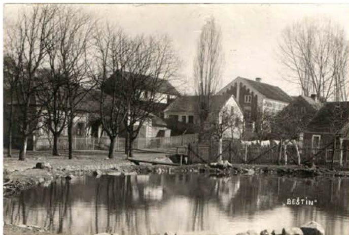
Běštín v roce 1929